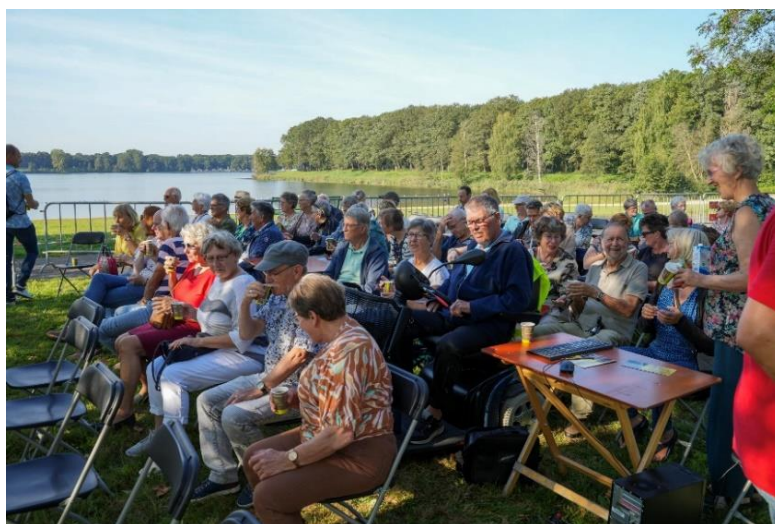
Aan de koffie op Keramisto

Na de ontvangst met koffie en vlaai werd de ontstaansgeschiedenis van Keramisto uit de doeken gedaan en daarna de geschiedenis van het pottenbakken in Milsbeek. Gelukkig werkte het weer, in tegenstelling tot de eerste keer dat Keramisto werd georganiseerd en het stortregende, nu wel mee. We konden heerlijk de 100 stands met prachtige keramiek bekijken.