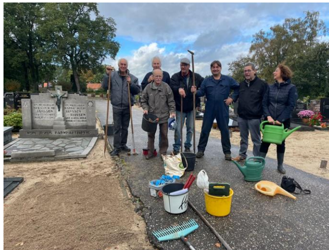
De graven zijn weer onderhouden