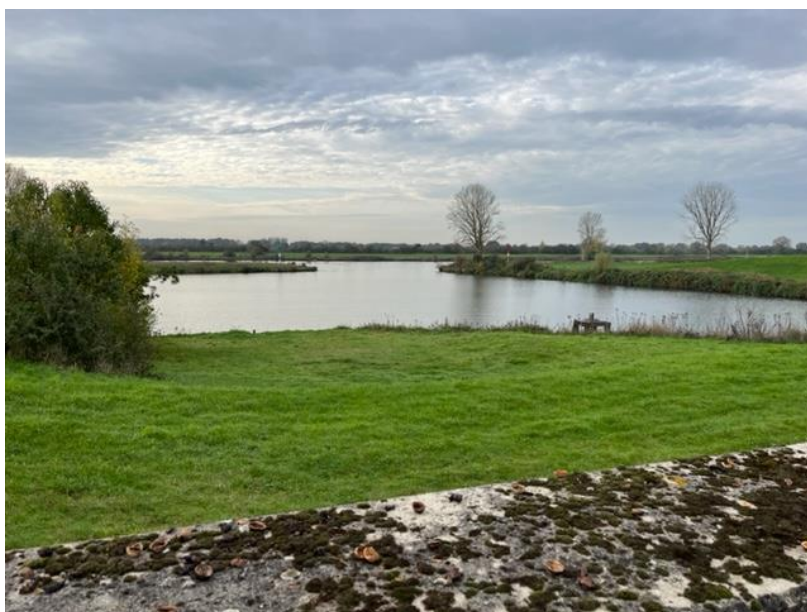
Langs de Maas

Het rondje krijgt steeds verder vorm, maar hoe het precies zal lopen is o.a. afhankelijk van de nieuwe Ringweg rond Milsbeek en de wandelaars kunnen het pas gebruiken als het struipad tussen de nieuwe huizen op het terrein van steenfabriek en de Maas klaar is.