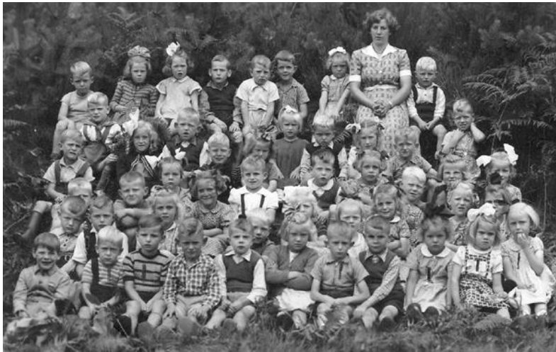
Een schoolfoto die wij beschikbaar willen stellen via de website

Als SCM willen we ons cultureel erfgoed op een goede manier opslaan en beheren en anderzijds dit erfgoed waar mogelijk op de juiste plaatsen beschikbaar stellen. Wij zijn ons aan het oriënteren welke zaken we via onze site beschikbaar willen stellen en welke zaken voor een veel breder publiek belangrijk zijn en via een externe site gepubliceerd kunnen worden; we hebben daarvoor inmiddels aansluiting gezocht bij Coöperatie Erfgoed Limburg.