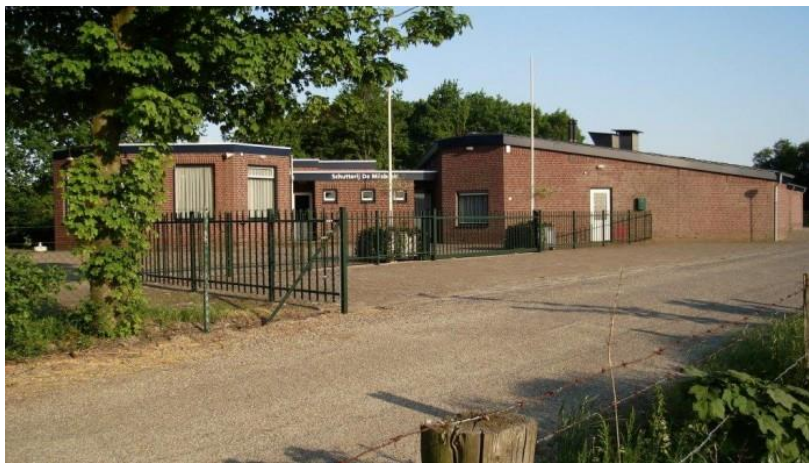
Onze vergaderlocatie bij De Schutterij

Sinds vorig jaar vergaderen we bij De Schutterij "De Milsbeek".