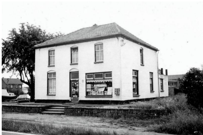
De oude Bakkerij Jacobs