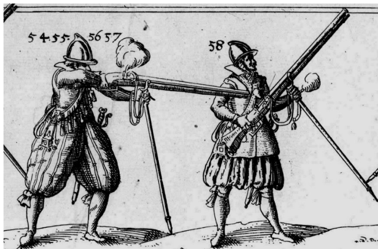
Soldaten uit de 80-jarige oorlog

Stichting Cultuurbehoud Milsbeek is al ruim een jaar samen met SLIM en de werkgroep Schuttersplein bezig om bij het Schuttersplein een kunstwerk te plaatsen dat herinnert aan de Milsbeekse historie. Er is flink vooruitgang geboekt en er wordt nu aan gewerkt om een figuur bij het plein te plaatsen dat gebaseerd is op onderstaande afbeelding.