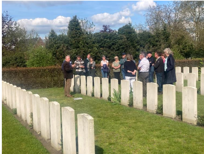
Uitleg op de militaire begraafplaats