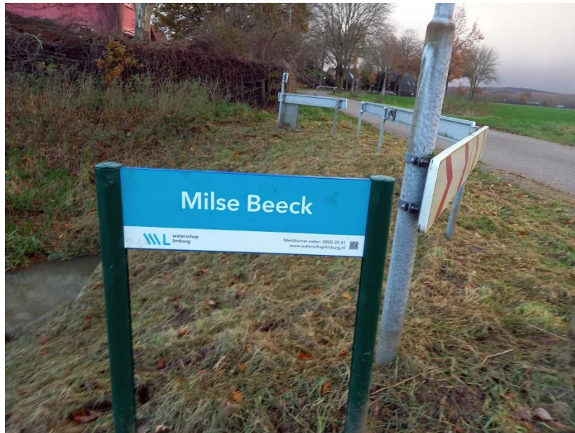
Het bordje met de nieuwe naam

De naamswijziging van Kroonbeek in Milse Beeck is gerealiseerd. Wij vonden deze naamsverandering belangrijk omdat deze beek de naamgever is van ons dorp en het goed is dat te laten zien via de historische naam van de beek. De nieuwe bordjes zijn geplaatst op verschillende plekken langs de beek.