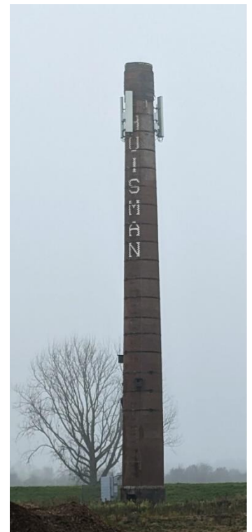
Hoe lang nog?