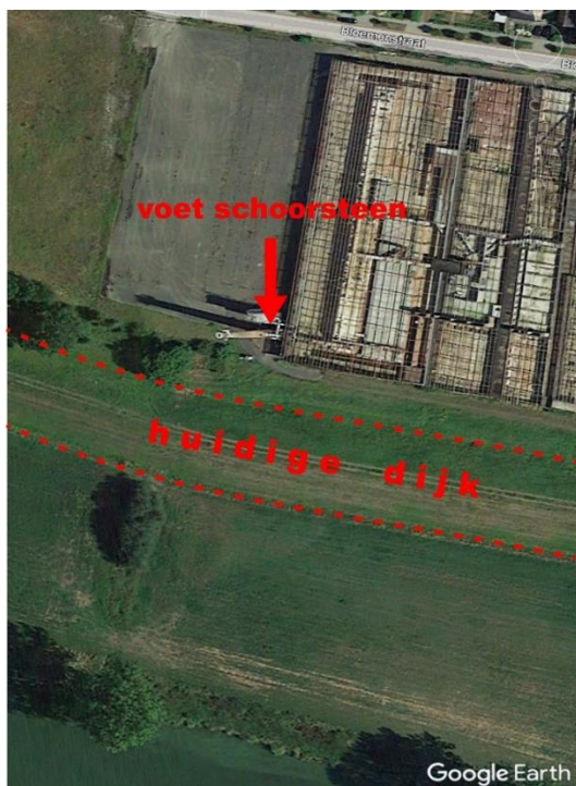
Schoorsteen 20 meter van de voet van de dijk!

Na de sluiting kwam Wienerberger al snel met plannen voor de 'herontwikkeling' van de steenfabriek. De nieuwe bestemming van het fabrieksterrein moest woningbouw worden, voor woningen in het duurdere segment. Begin 2022 bereikten Gemeente Gennep en Wienerberger hier overeenstemming over.