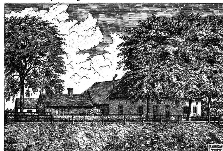
Ets van de boerderij De Kroon door Bernard van Dam (© Stichting Bernard van Dam)

De boerderij en verscheidene omliggende percelen waren in 1732 eigendom van de Erben Peter Krohn. Of de boerderij is genoemd naar de bewoners Krohn of naar het vlakbij gelegen "kroonwerk" van het Genneperhuis is niet duidelijk. De Kroon was vele jaren een van de grootste boerderijen van Milsbeek.