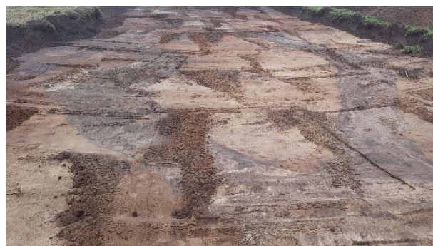
Het dubbele deel van de loopgraaf

Enkele van de gevonden attributen