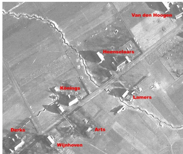
Een deel van de loopgraaf

In september en december heeft de Britse luchtmacht RAF tientallen luchtfoto's gemaakt van ons dorp en omgeving. Op de foto's van december is zeer duidelijk een loopgraaf zichtbaar. Deze begint bij het kroonwerk van het Gennepershuis en gaat via het Sprokkelveld, de Olde Kruyk, langs de boerderij van Hoenselaars en dan via de Teelebeekstraat naar het eind van de Zwarteweg aan de voet van het Reichswald.