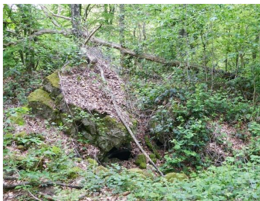
De resten van een van de bunkers.

Als afsluiting van de vakantieperiode maken we deze keer een uitstapje naar Duitsland, naar het Reichswald in de omgeving van Milsbeek en Grafwegen.