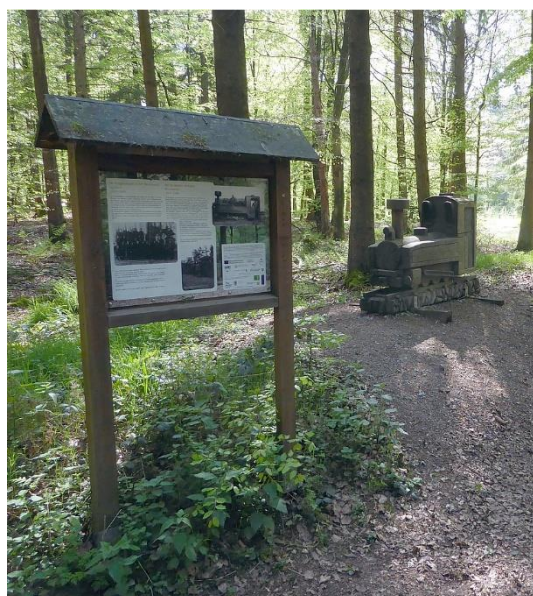
Het smalspoor bij de Gennepweg.

Ook op andere plaatsen bouwden de Duitsers dergelijke linies bij hun grenzen. Na de oorlog werd in het verdrag van Versailles bepaald dat alle linies geslecht en de bunkers opgeblazen moesten worden. Ook bij ons in het Reichswald is dit in 1921 gedaan. Op veel plaatsen zijn de linies verdwenen, maar bij Elten en bij Grafwegen, de Jansberg en de Diepen zijn de linie en de resten van de bunkers nog aanwezig. Vanaf de Diepen is naar het noorden nog ongeveer 7 kilometer zichtbaar. De overblijfselen van deze linies uit de eerste Wereldoorlog bij Elten en in onze streek zijn uniek in Duitsland; slechts op een andere plaats is nog een deel van een linie bewaard gebleven. De stellingen bij Elten zijn onlangs archeologisch onderzocht om meer duidelijkheid te krijgen over de opbouw ervan. Over de aanleg van de linies heeft het Duitse leger zeer weinig vastgelegd; er is dus weinig over bekend.