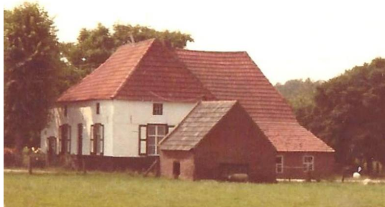
Het huis toen het bewoond werd door Lambert Verhasselt